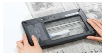
反転シースルースキャン

ToRiZo は思い出のこもった写真のデジタル化に最適なスキャナとして次の 5 つの特長をもつ商品として市場導入し、お客様のご好評をいただいております。